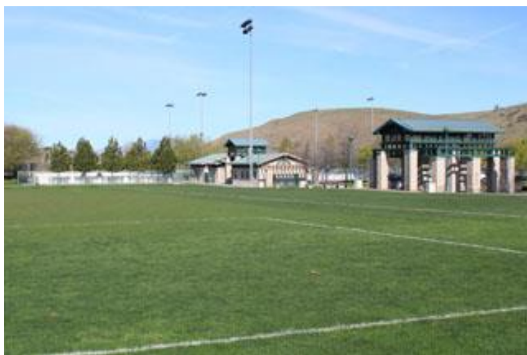
Grand Ave Park

奇诺岗邻居是我住过的城市中最友善的，我们会住过 Sun Valey , Arleta , Glendora , Pasadena , 及 West Covina。在奇诺岗已住了快七年，邻居就像小型的联合国。对面住的是墨西哥籍的。邻居则为当地白人。后面的则为南美来的非洲籍的，再过一家则是菲律宾来的。我们虽从世界不同之处来到奇诺岗，但我们却都有一个梦想—美国梦和健康快乐人生。